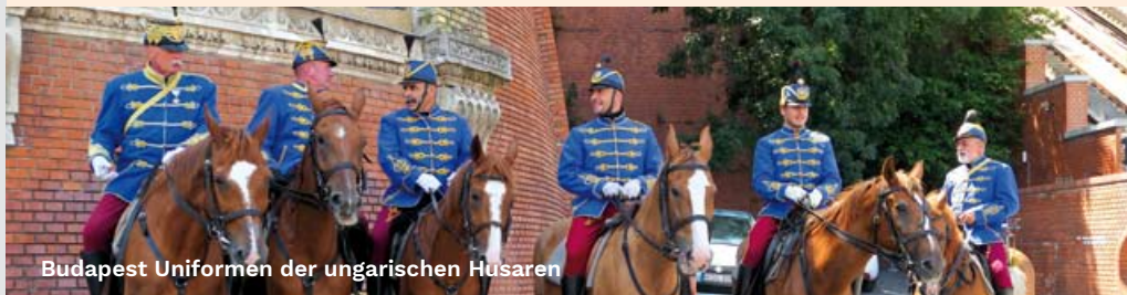
Budapest Uniformen der ungarischen Husaren